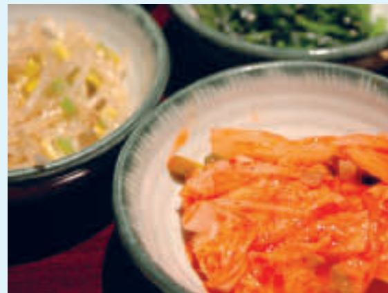
Koreanske småretter

I de siste årene har kimchi fått global anerkjennelse og er matretten som representerer Sør-Korea. Den mest vanlige varianten av kimchi er laget ved å blande saltet hvitkål med kimchipasta laget av chilipulver, hvitløk, vårløk, koreansk reddik, ingefær, fiskesaus og andre ingredienser, som f.eks. fersk sjømat. Kimchi spises oftest etter å ha blitt fermentert i flere dager og noen fermenterer den til og med i over et år. Kimchi er en del av de fleste koreanske måltider og spises hovedsakelig som en siderett.