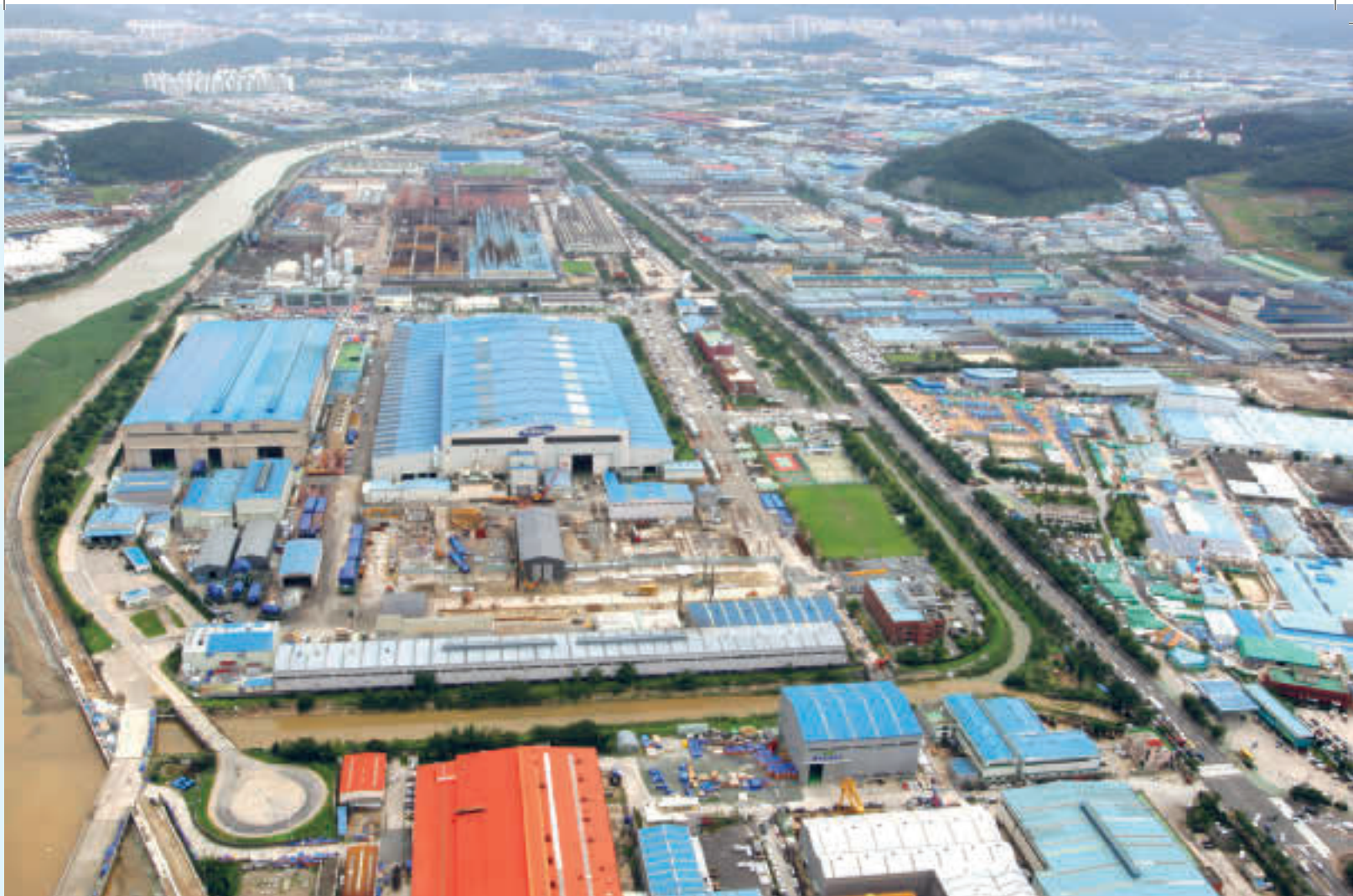
Industrielle kompleks i Changwon

trien. Norge eksporterer for det meste ulike skipsdeler, maskiner og fiskeprodukter til Sør-Korea og importerer i retur hovedsakelig skip, oljeplattformer, dekk, biler og forbrukerelektronikk. Geografisk sett ligger Sør-Korea i nærheten av Kina og Japan og har i tillegg frihandelsavtaler med både Kina og India. Det vil si at Sør-Korea er et veldig attraktivt land for norske selska-