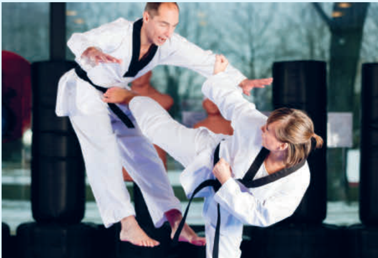
Taekwondoutøvere med svart belte