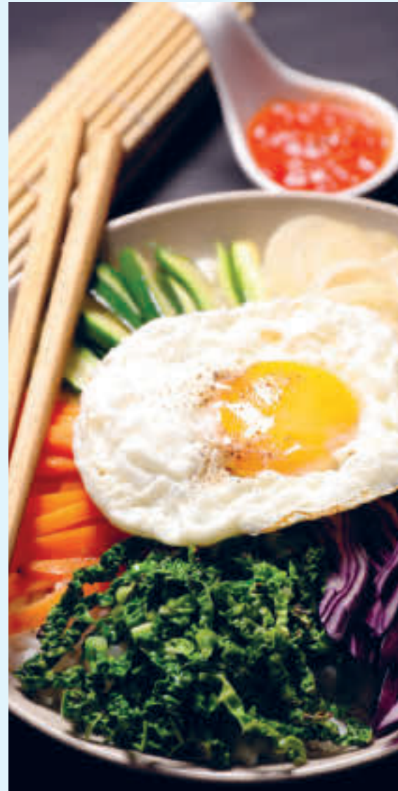
Bibimbap: Kokt ris med ferske og krydrede grønnsaker, hakket biff og chilipasta

En annen og kanskje litt mindre globalt kjent rett, bibimbap , som bokstavelig oversettes til "blandet ris", er svært populær i Sør-Korea. Dette er både fordi den er rik på næringsinnhold siden den inneholder mye grønnsaker, men også fordi den ser bra ut. Koreansk mat setter nemlig fokus på fargebalanse bygget på filosofien om «fem elementer». Hvert element (eller farge) har sine egne næringsverdier og skaper dermed en perfekt balanse for et næringsrikt måltid.