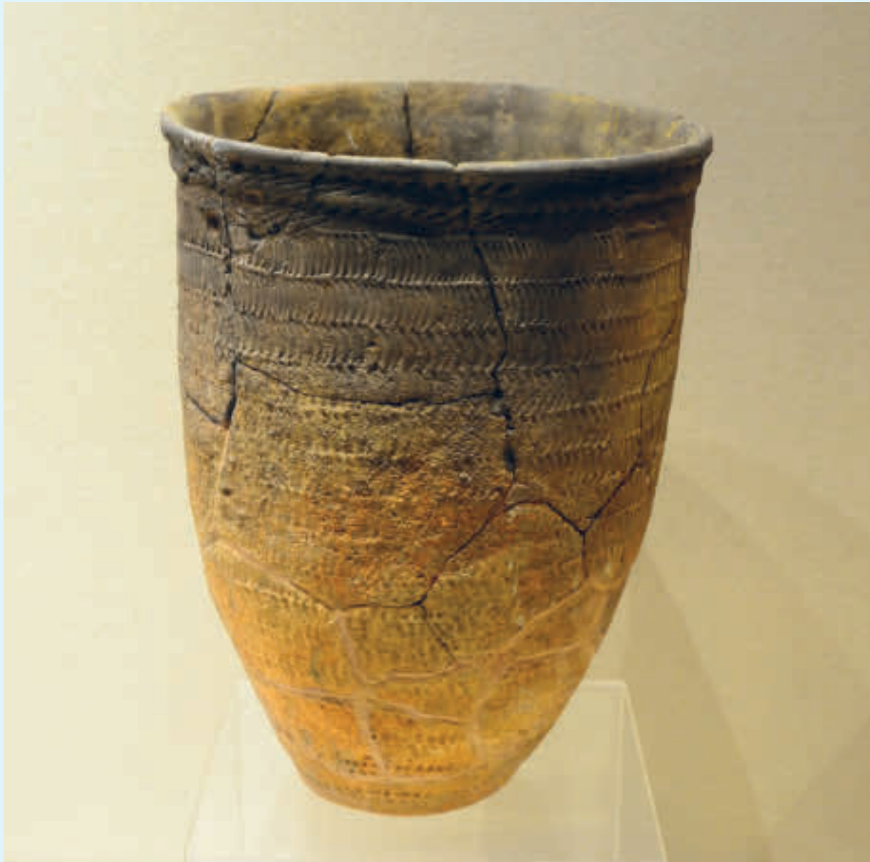
En keramikkjenstand funnet i Seoul-området fra forhistorisk tid