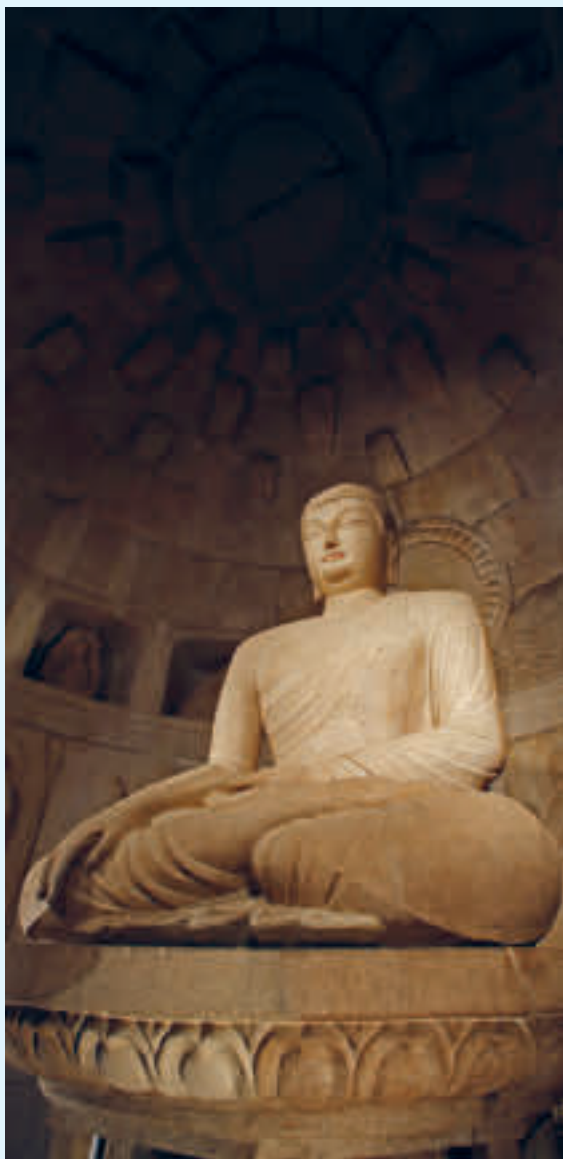
Seokguram-grotten med Buddha-statuen som er på UNESCOs verdensarvliste.