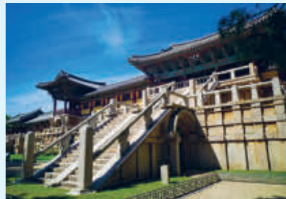
Bulguksa-tempelet ligger i byen Gyeongju og er også på UNESCOs verdensarvliste.

Buddhismen ankom det som i dag er Sør-Korea i år 372 og det finnes flere titusener av templer over hele landet. Det er buddhismen som har aller flest tilhengere av alle religionene i Sør-Korea.