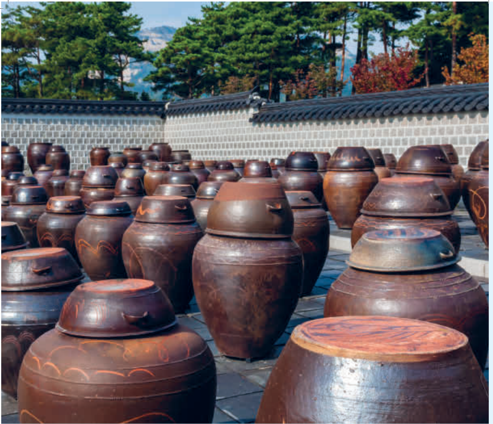
Krukker brukt til fermentering av mat. Her fra Gyeongbokgung-palasset i Seoul