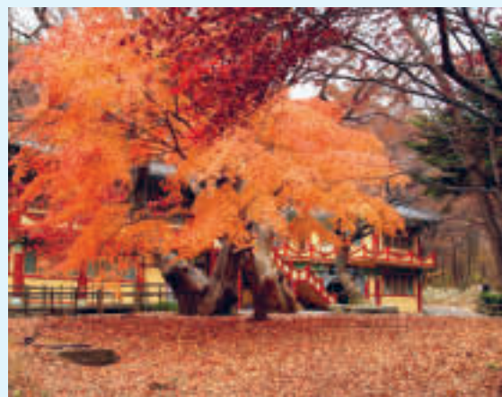
Gyeryongsan nasjonalpark i Sør-Korea

Høsten på Koreahalvøya er tiden for innhøsting av bl.a. ris, søtpoteter, poteter, epler, pærer, bokhvete og soyabønner, og er den perfekte tiden til å besøke tradisjonelle folkelandsbyer – små samfunn som også i dag bevarer det tradisjonelle levesettet fra sine forfedre. Dette gjøres som oftest i løpet av feiringen av Chuseok , som er navnet på Koreahalvøyas innhøstingsfest som varer i tre dager. Denne feiringen minner om den amerikanske feiringen Thanksgiving , eller høsttakkefest på norsk.