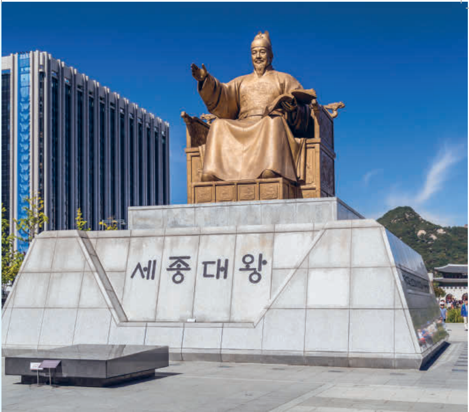
Grunnleggeren av hangeul, Kong Sejong av Joseon-dynastiet