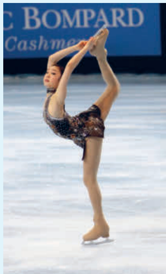
Yuna Kim

I likhet med Norge er Sør-Korea et land med mye vinteridrett. Landet er bl.a. kjent for kunstløp med Yuna Kim i spissen. Hun har satt verdensrekorder i kunstløp og har også vært ambassadør for vinter-OL for ungdom, blant annet i Lillehammer i 2016. Hun har trent flere norske kunstløpere og vært en inspirasjon for mange. Pyeongchang, som er et fylke nordøst i Sør-Korea, ble tildelt vinter-OL i 2018. Det er andre gang Sør-Korea er OL-vert.