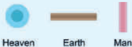
De tre materialene himmelen, jorden og mennesket © The Academy of Korean Studies Press

Hangeul er en fonemisk skriveform som er sammensatt av stavelser. Et fonem er det minste lydsegmentet som kan endre betydningen av et ord, f.eks. lyden «g».