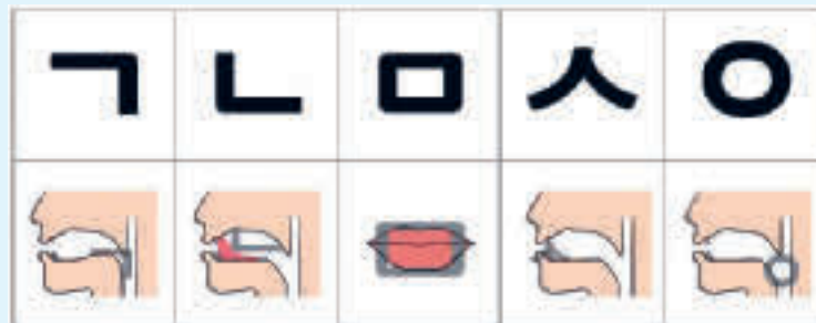
g - n - m - s - ng. Disse fem er de grunnleggende bokstavene som alle andre bokstaver er basert på