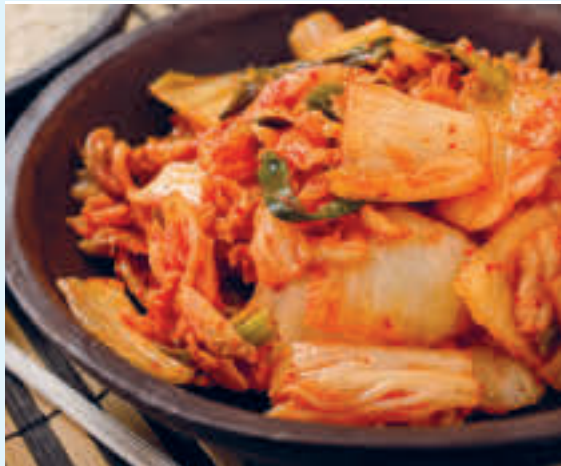
Kimchi klar til servering