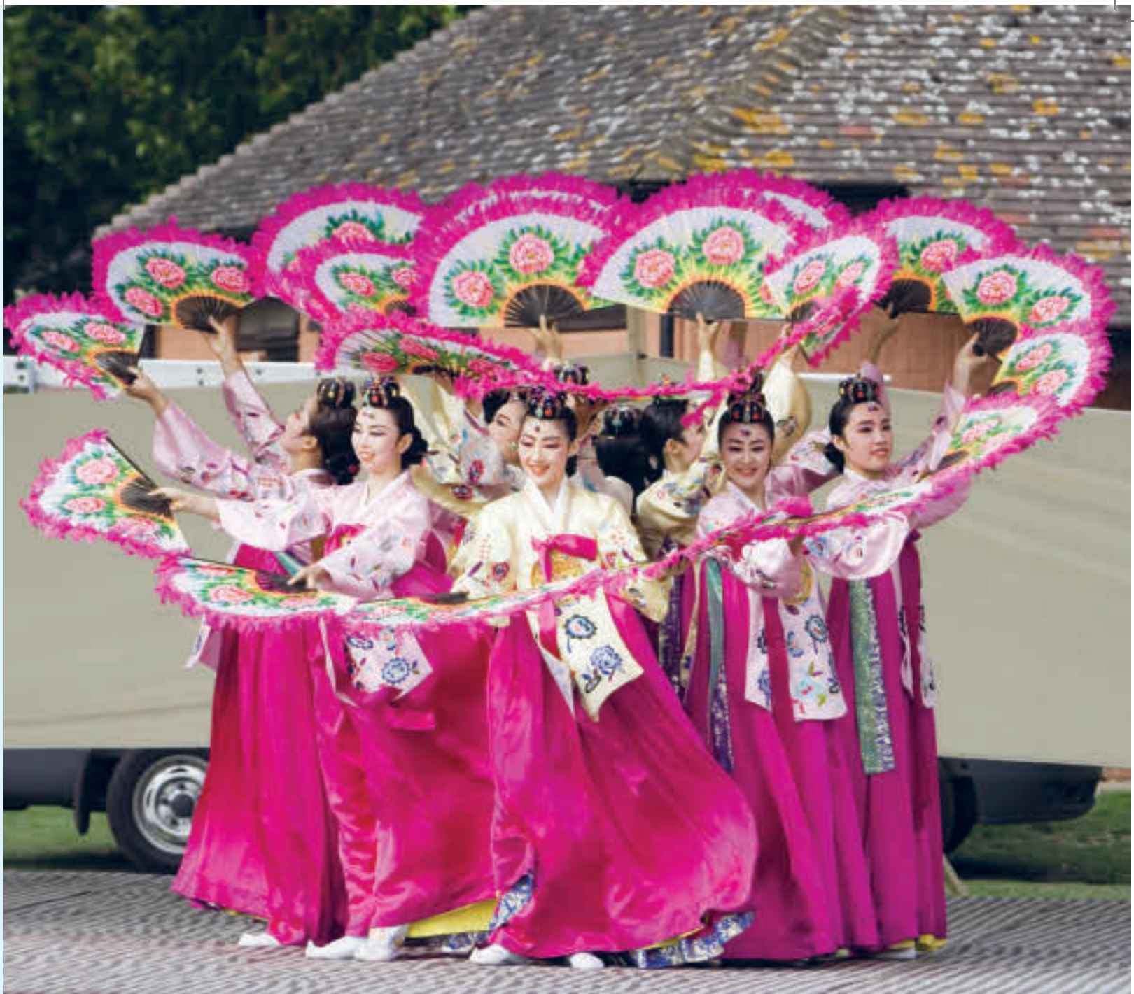
Tradisjonell dans