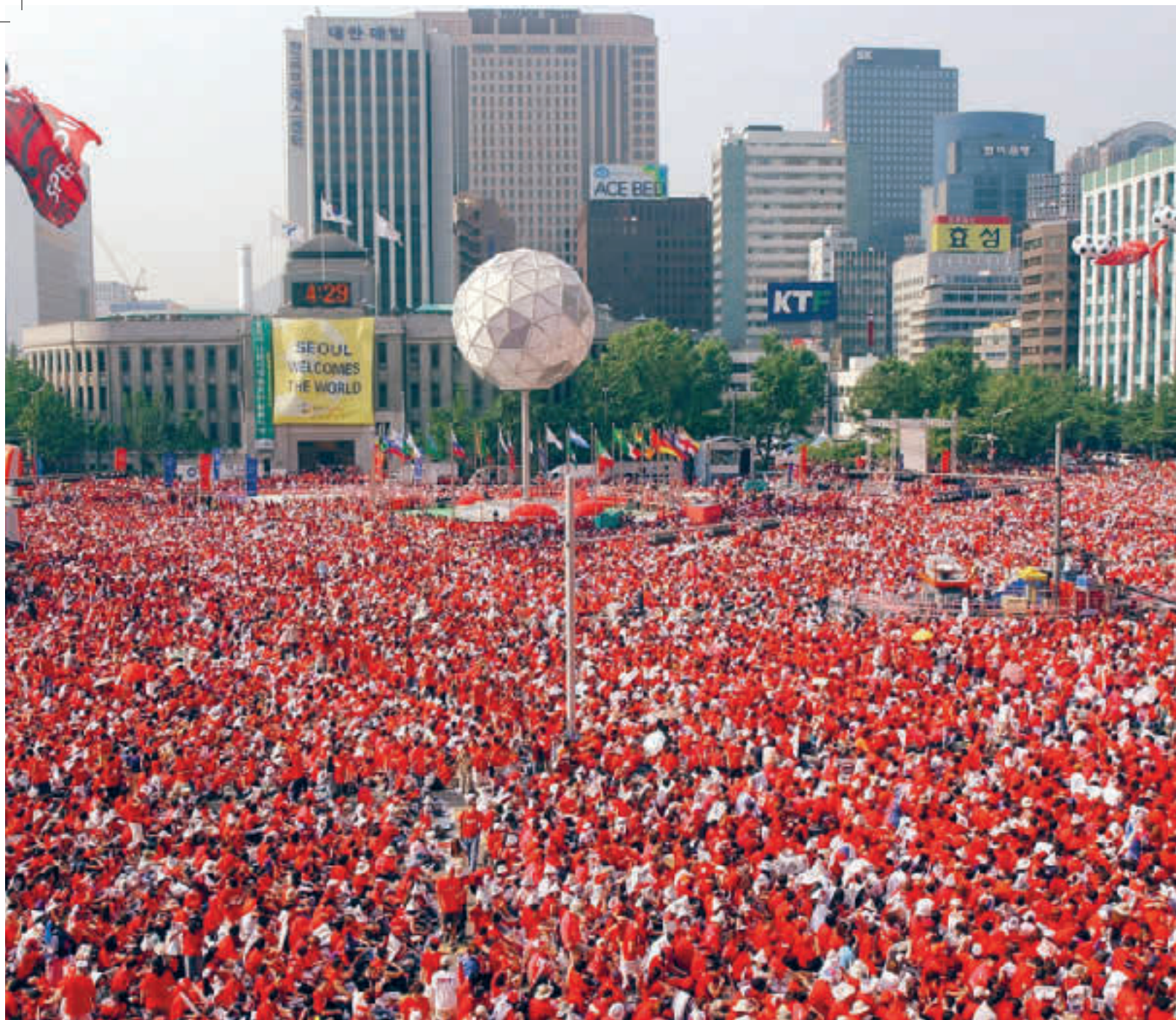
VM i fotball i Sør-Korea i 2002