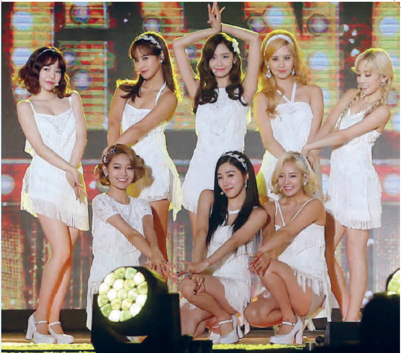
Girls' Generation. En av Sør-Koreas første og største Kpop-grupper som startet i 2007