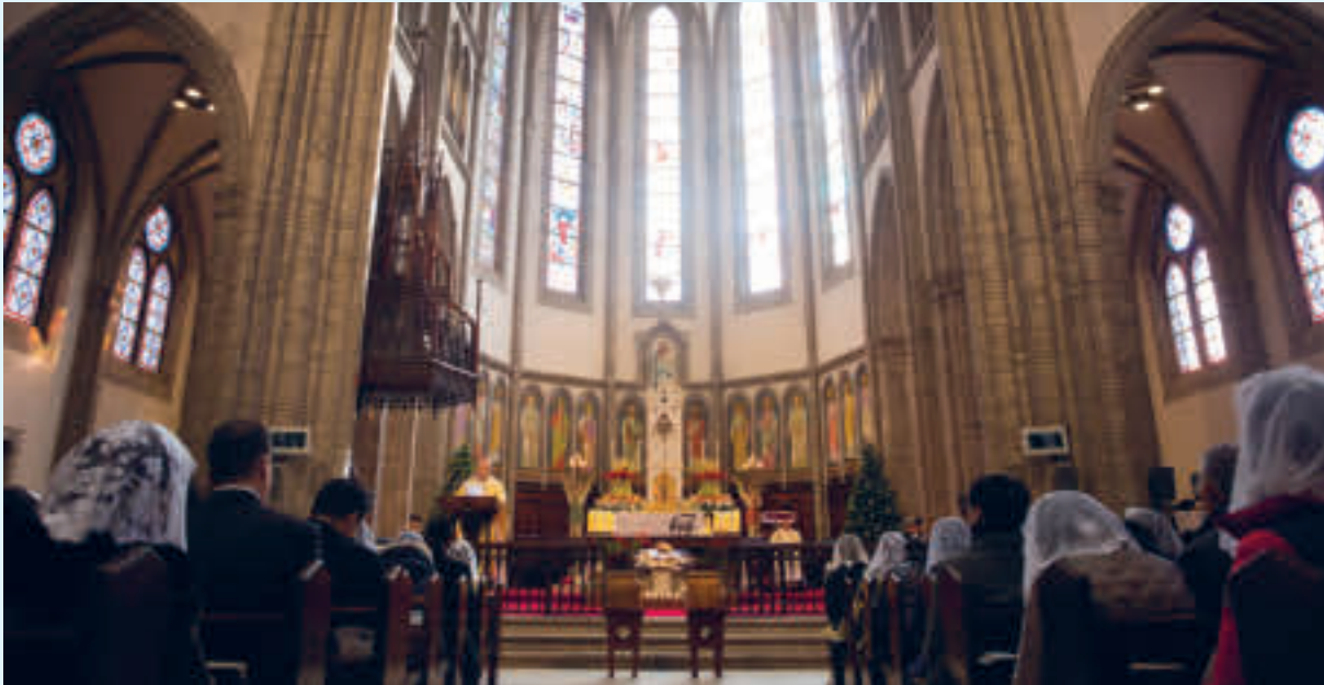
Myeongdong-katedralen i Seoul

Katolisismen ble introdusert til Korea fra Kina via Joseon-utsendinger som besøkte Beijing som en del av koreansk-kinesisk diplomati. Disse utsendingene utgjorde en viktig del av de internasjonale relasjonene mellom de to landene. Vestlige prester ble med Joseon-utsendingene tilbake til Korea og slik ble katolisismen spredd. De tidlige katolikkene i Korea ble utsatt for sterk forfølgelse, men religionen fortsatte å spre seg blant folket i landet.