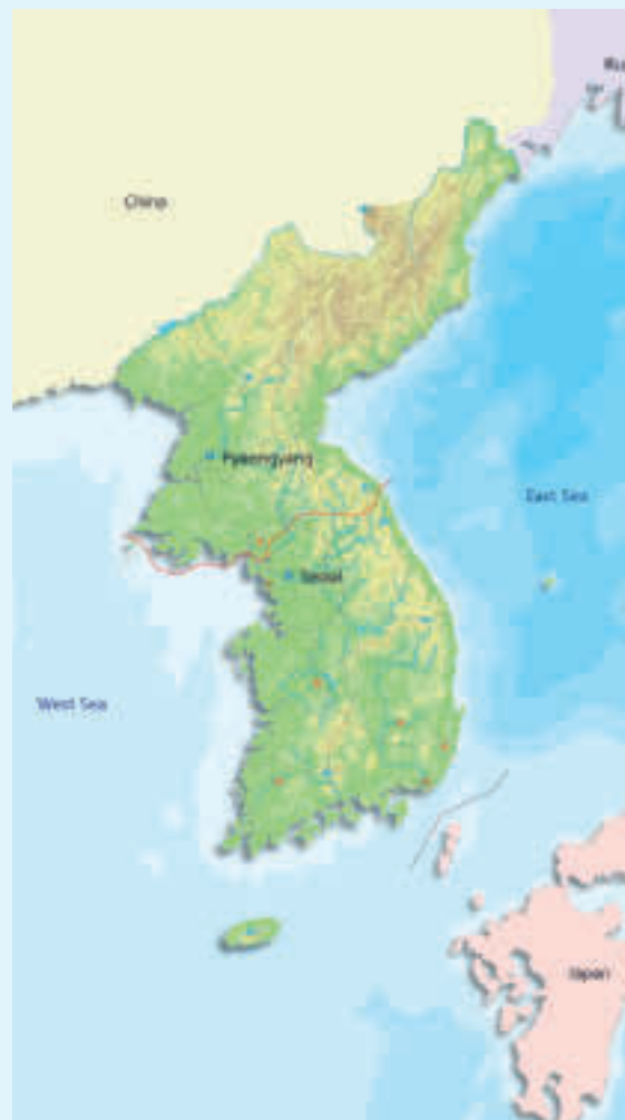
Kart over Koreahalvøya © Korean Culture and Information Service

ningen i Sør-Korea på ca 50,56 millioner, hvor nesten halvparten er konsentrert i Seoul og nærområdene, mens Nord-Korea består av en befolkning på 25,12 millioner.