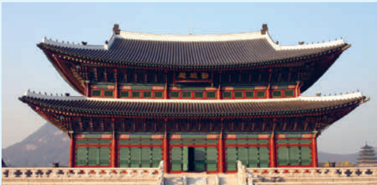
Gyeongbokgung-palasset som var det viktigste kongelige palasset under Joseon-perioden