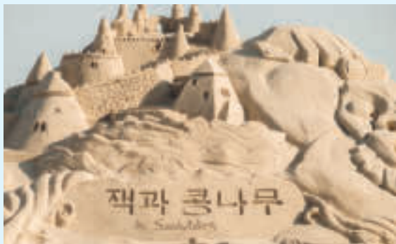
Sandfestivalen på Haeundae-stranden i Busan

Våren på Koreahalvøya er full av fargerike blomster, men kjennetegnes hovedsakelig av kirsebærblomstene. Disse har som oftest en lyserosa farge og er i full blomst i ca en ukes tid. Sommeren har høy luftfuktighet og høye temperaturer, mens høsten er mildere og likner på den norske høsten. Om vinteren snør det, men det er en del varmere enn i Norge. Den kaldeste måneden er januar, som har en gjennomsnittstemperatur på 1,6 °C. Med hav på tre sider og et landareal hvor mer enn halvparten er fjell, har det koreanske folket utviklet både ulike kulturer og kongedømmer som har vært jordnære og i tett relasjon til naturen.